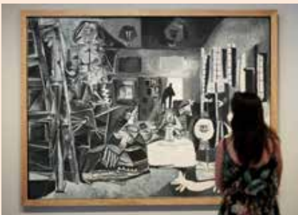
Admiring 'Las Meninas' - Picasso Museum

Die europäische Wander-Biennale und Kunstausstellung, Manifesta 15, ist 2024 in Barcelona zu Gast. Neben zahlreichen architektonischen Highlights wie der Sagrada Familia von Gaudí, dem Passeig de Gràcia mit Prachtbauten und der gotischen Altstadt sowie bedeutenden Museen, ist Barcelona ohnehin schon ein Paradies für Kulturliebhaber*innen. Mit der „Manifesta 15“ erweitert sich die Kunststadt um die drei Randbezirke, die Region um den Fluss Llobregat, den Stadtteil um den Fluss Besòs und die Höhenlage Richtung Collserola Berge.