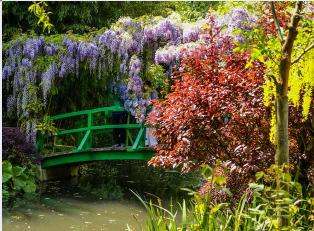
Claude Monet Garten in Giverny