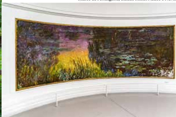
Musée de l'Orangerie, Claude Monet Ninfee e Nuvolo