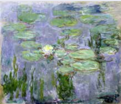
Claude Monet, Seerosenteich Marmottan

In drei Pariser Museen sehen Sie das großartige Werk Monets: im noblen Jagd- schloss Marmottan seine kühnen Gemälde aus dem Nachlass, in der Orangerie die großformatigen Seerosenpanoramen und im Musée d'Orsay einen Überblick über sein Gesamtwerk. Bei einem Spaziergang am Montmartre entdecken Sie legendäre Orte, an denen Renoir, Picasso, van Gogh und andere namhafte Künstler lebten und arbeiteten. Höhepunkte der Reise sind der Besuch des Gartens von Giverny, der jetzt in intensiven Farben blüht, eine Bootsfahrt mit dem Schiff „Guillaume le Conquérant“ in der Auenlandschaft der Seine sowie ein Abendessen und klassisches Konzert in einer traumhaften Mühle mit einer klassizistischen Orangerie direkt an der Seine